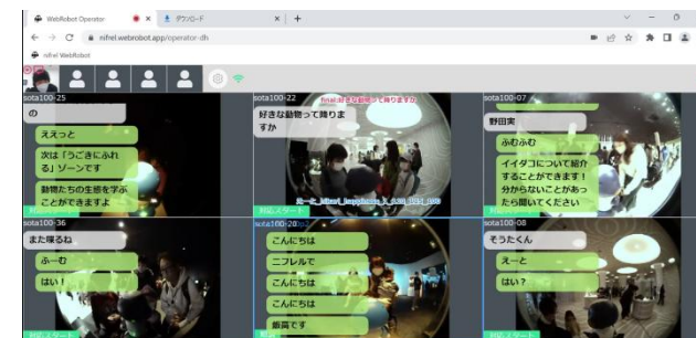
水族館での実証実験に用いられたユーザインターフェース